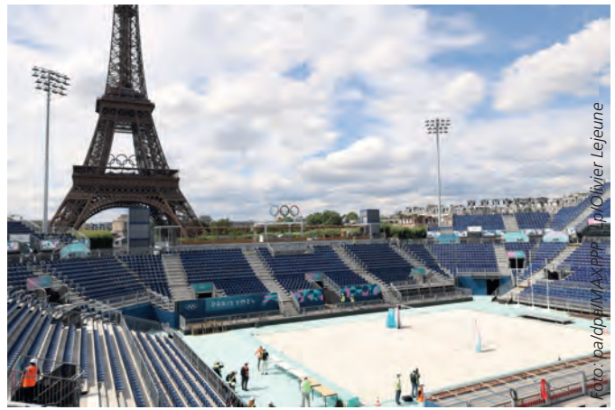
Es kann losgehen: Letzte Vorbereitungen werden für die Beachvolleyball-Wettbewerbe getroffen.

Die „Danas“ (Damen-Nationalmannschaft) und „Honamas“ (Hockey-Nationalmannschaft Männer) – wie die beiden Teams genannt werden – streben nach den medaillenlosen Spielen von Tokio wieder Gold, Silber oder Bronze an.