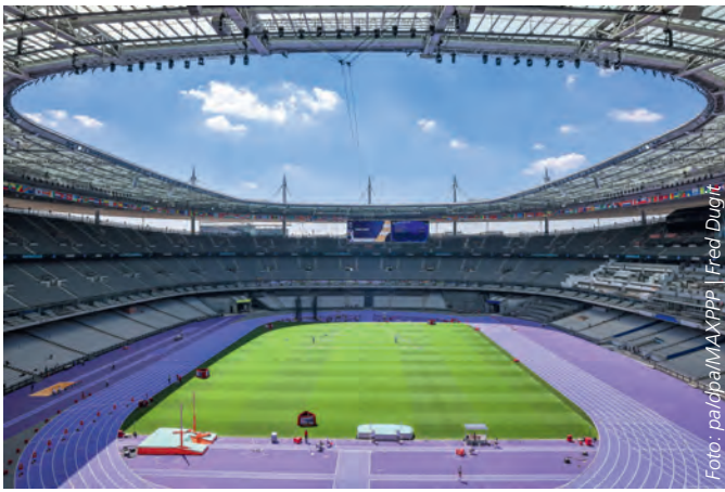
Spannende Wettkämpfe werden in der größten olympischen Arena, dem Stade de France, erwartet.

seinen Durchbruch in der vergangenen Saison mehrfach ausgezeichnet und unterstrich seine Olympia-Ambitionen im Juni, als er den deutschen Rekord auf 8.961 Punkte verbesserte.