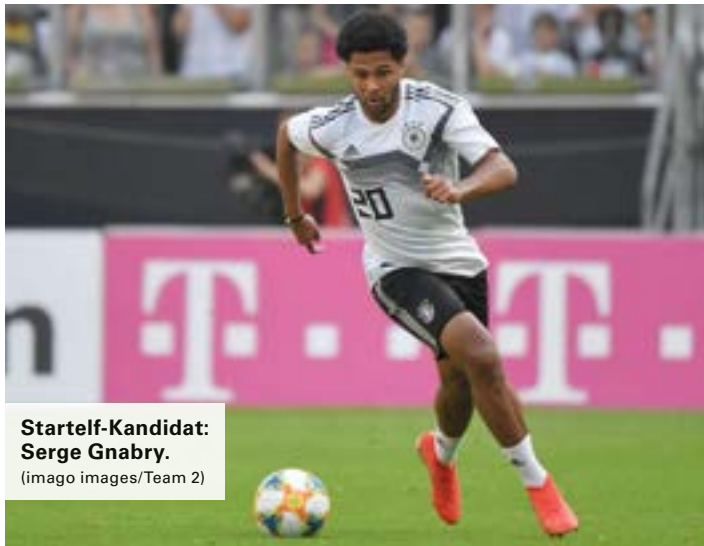
Startelf-Kandidat: Serge Gnabry.