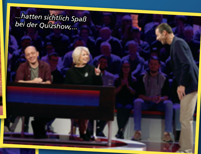
...hatten sichtlich Spaß bei der Quizshow,...