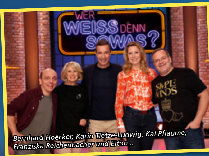
Bernhard Hoëcker, Karin Tietze-Ludwig, Kai Pflaume, Franziska Reichenbacher und Elton...