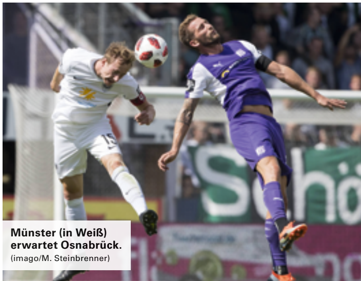
Münster (in Weiß) erwartet Osnabrück.