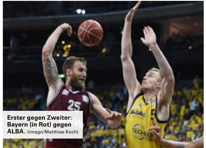
Erster gegen Zweiter: Bayern (in Rot) gegen ALBA.

ALBA Berlin: Für die Albatrosse ist es das erste Wiedersehen mit München nach der Playoff-Finalserie 2017/18. Diese verloren sie mit 2:3 nach Spielen. Zuletzt gelang Berlin ein 87:74-Sieg gegen Frankfurt.