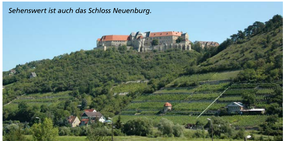
Sehenswert ist auch das Schloss Neuenburg.

Entlang der touristischen Route durch Sachsen-Anhalt wurde in den zurückliegenden Monaten Fünfundzwanzigjähriges gefeiert. Im Advent runden weihnachtliche Konzerte, Märkte und Führungen das Jubiläumsjahr ab. Doch auch ohne Feierlichkeiten ist die Straße der Romanik sehenswert.