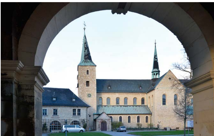
Die Straße der Romanik führt auch zum Kloster Huysburg, zur Landesschule Pforta und zum Merseburger Dom und Schloss (Bilder nächste Seite).

Ruhig ist es im Winter auch auf dem Gelände des Landesweingutes Kloster Pforta, durch das diese Straße führt, geworden. Vor dem Gutsrestaurant Saalhäuser Weinstuben ist auf einer Tafel zu lesen, dass in der kalten Jahreszeit kürzere Öff-