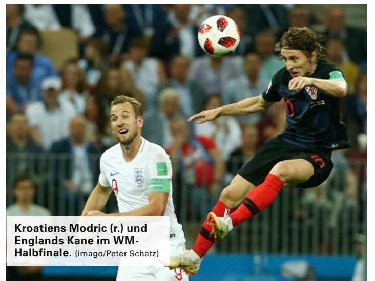
Kroatiens Modric (r.) und Englands Kane im WM-Halbfinale.

Kroatien: Genau 93 Tage nach ihrem WM-Halbfinal-Sieg (2:1 n.V.) treffen die Kroaten erneut auf England. Für Modric & Co. endete aber inzwischen der Höhenflug abrupt: 0:6 verlor man zuletzt in Spanien. England: Auch Kane & Co. mussten sich nach der WM den wiedererstarkten Spaniern geschlagen geben (1:2). Mit einem 1:0 im Freundschaftsspiel gegen die Schweiz rehabilitierte man sich aber wieder.