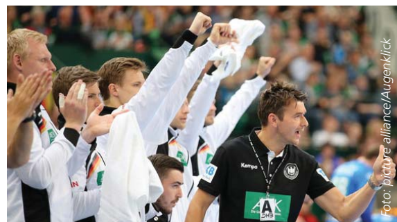
Bundestrainer Christian Prokop: Daumen hoch für die „Bad Boys“.

Kapitän Uwe Gensheimer musste bei der EM 2016 verletzt zuschauen. Umso heißer ist der gebürtige Mannheimer auf den Titel in Kroatien. „Wir werden gejagt, sind aber als Mannschaft gut gerüstet“, glaubt der für Paris SG spielende Linksaußen. Prokop ergänzt: „Wir wollen eine erfolgreiche EM spielen, doch eine Titelverteidigung darf nicht als selbstverständlich angesehen werden.“ Der