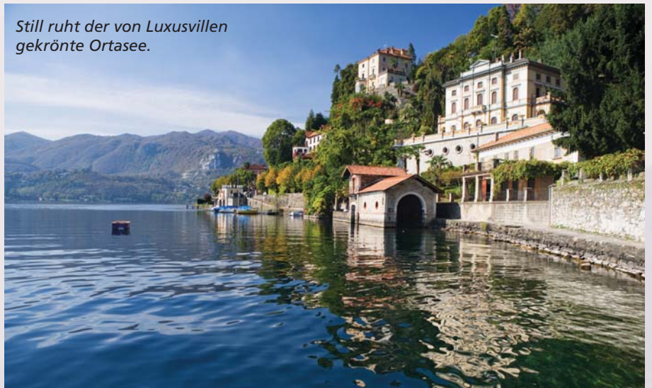
Still ruht der von Luxusvillen gekrönte Ortasee.

Am Rande geben Gaukler, Zauberer und Jongleure ihr Bestes. Auf dem Trüffelmarkt in Alba stept der Bär. Ein guter Teil der knapp 32.000 Einwohner der Stadt ist auf den Beinen. Gourmets aus aller Welt drängen sich dicht an den Verkaufsständen vorbei, an denen die besten Pilzknochen des Weißen Albatruffels für viel Geld angeboten werden. Liebhaber von Delikatessen finden daneben alles, was die Region zum Thema Tafelfreuden produziert.