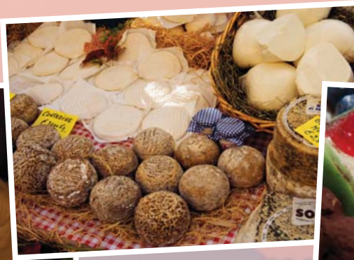
Trüffel, Käse, süße Leckereien – was will man mehr?