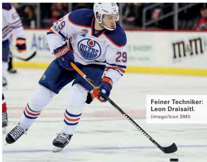
Feiner Techniker: Leon Draisaitl.