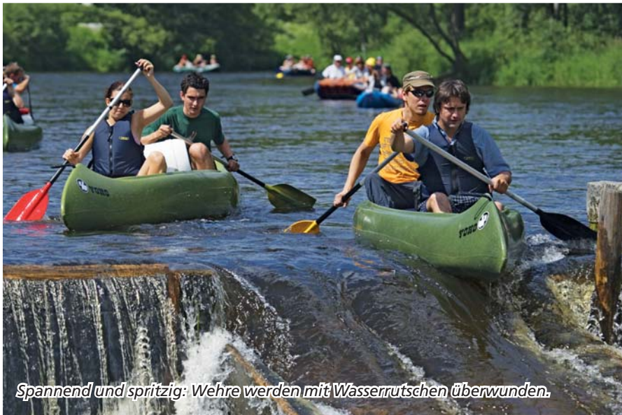
Spannend und spritzig: Wehre werden mit Wasserrutschen überwunden.