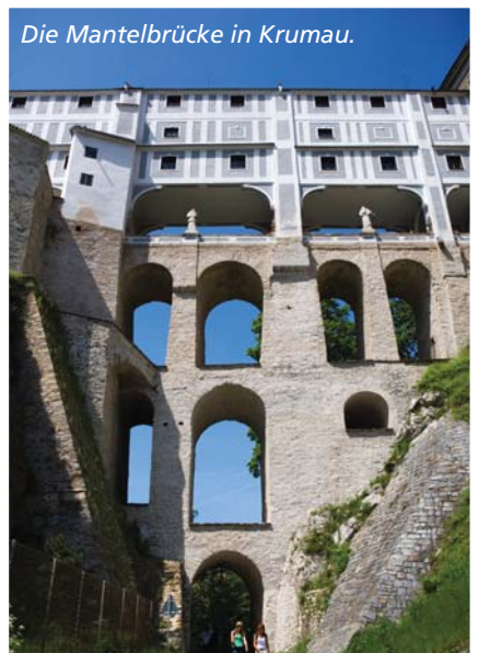
Die Mantelbrücke in Krumau.

Die örtliche Budejovický-Budvar-Brauerei zieht seit über 100 Jahren gegen die amerikanische Anheuser-Busch-Gruppe zu Gerich, um sich den Markennamen zu sichern. „Budweiserstreit“ wird der längste Prozess der internationalen Wirtschaftsgeschichte genannt. Von Budweis kann man sich vom Bootsverleiher zum Ausgangsort bringen lassen oder aber ein Auto mieten und das stille Barock-Bauerdorf Holasovice besuchen, die Sgraf-