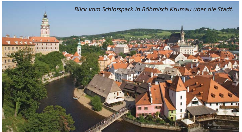
Blick vom Schlosspark in Böhmisches Krumau über die Stadt.