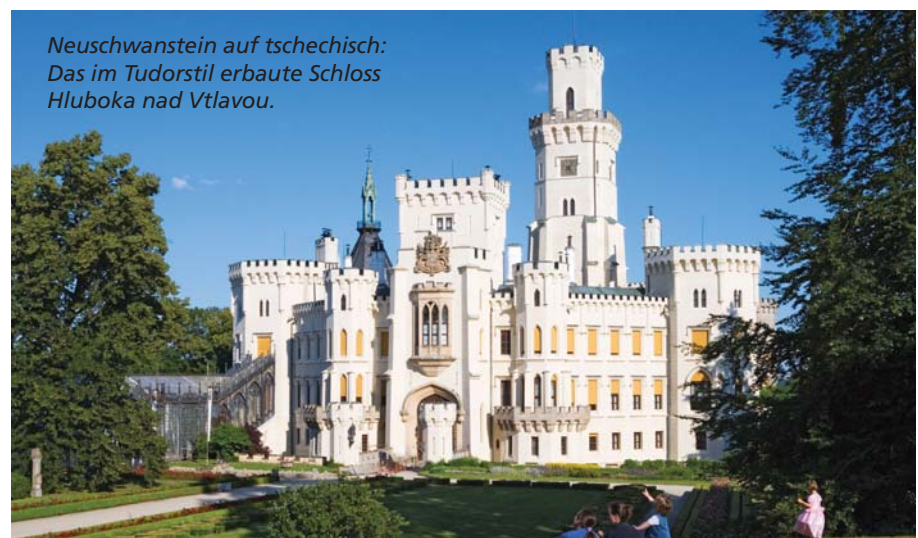
Neuschwanstein auf tschechisch: Das im Tudorstil erbaute Schloss Hluboka nad Vltavou.