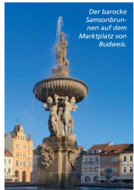
Der barocke Samsonbrunnen auf dem Marktplatz von Budweis.

fite-Fassaden von Prachatice bewundern oder im böhmischen Neuschwanstein Hluboka nad Vltavou staunen.