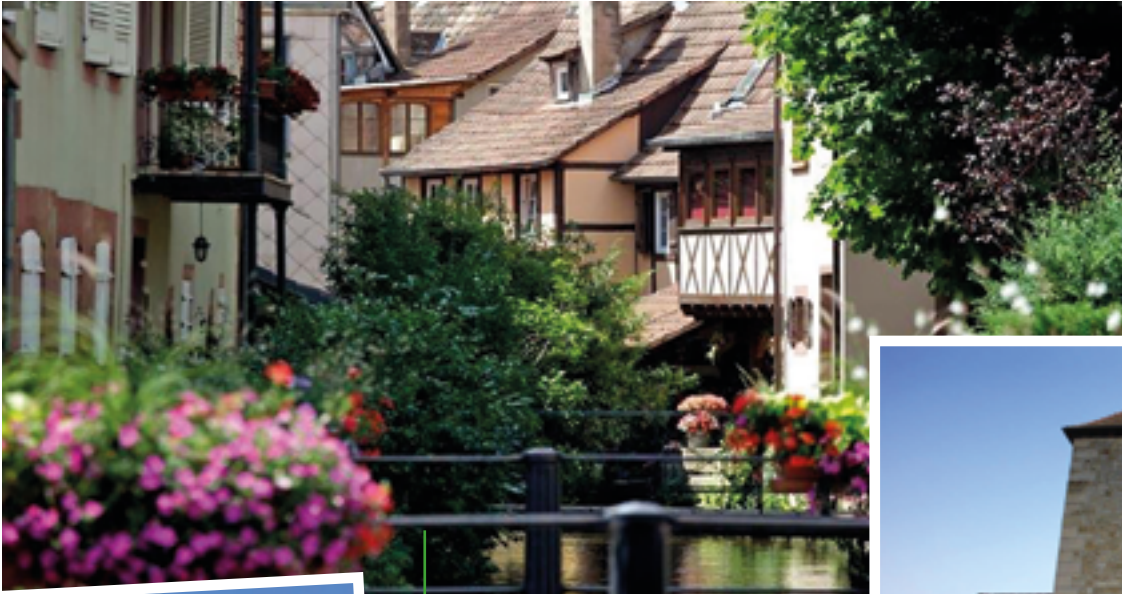
Immer einen Abstecher über die Grenze wert: Wissembourg mit seiner malerischen Altstadt.