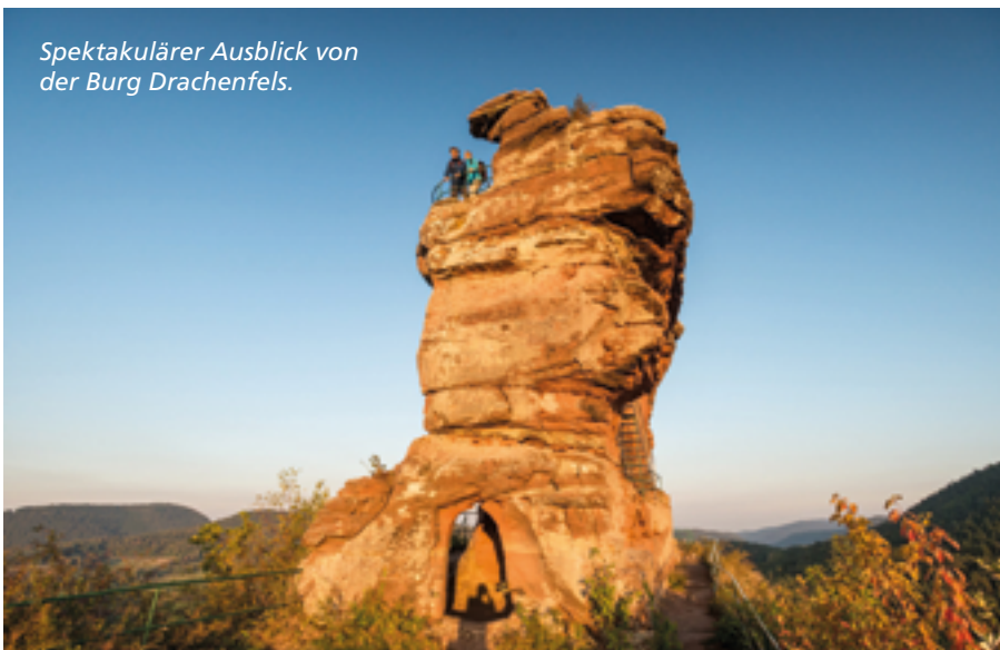
Spektakulärer Ausblick von der Burg Drachenfels.

Der Pfälzer Waldpfad erstreckt sich über 143 Kilometer und unterteilt sich in neun Etappen (leicht bis mittelschwer) vom Hauptbahnhof Kaiserslautern über Johanniskreuz, Rodalben, Hauenstein, Dahn bis Schweigen-Rechtenbach am Deutschen Weintor. Einzelne Abschnitte sind gut per ÖPNV zu erreichen.