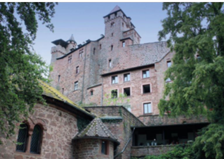
Burg Berwartstein, die legendäre Festung des Raubritters Hans Trapp.