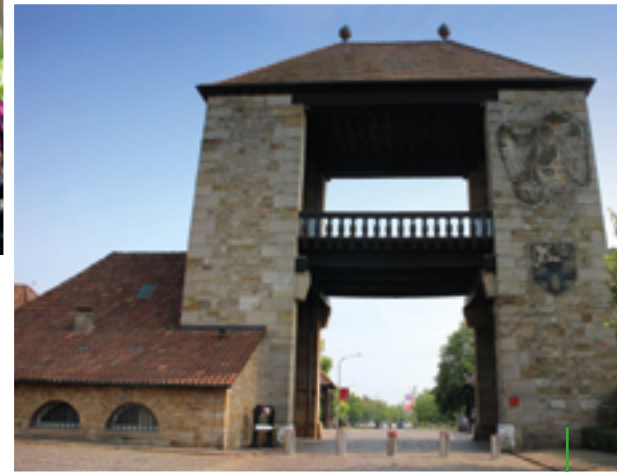
Das Deutsche Weintor in Schweigen-Rechtenbach. Start und Ziel populärer Wanderwege.