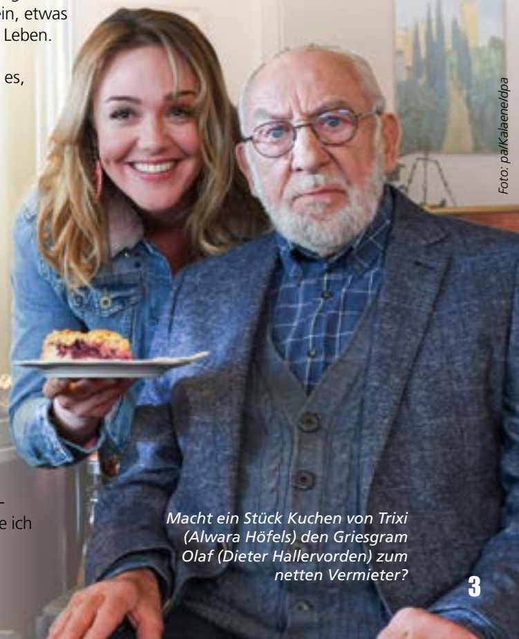
Macht ein Stück Kuchen von Trixi (Alwara Höfels) den Griesgram Olaf (Dieter Hallervorden) zum netten Vermieter?