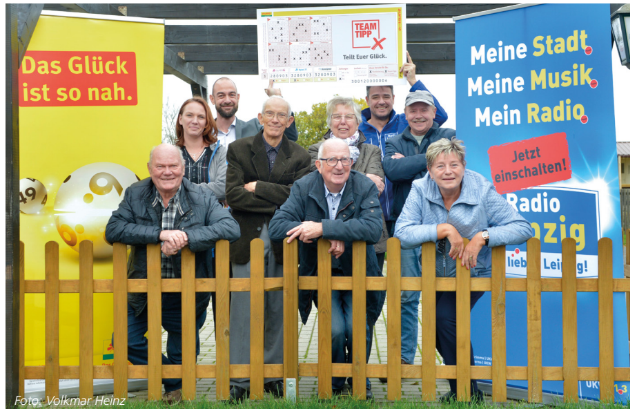
Freude im Kleingartenverein Ostende! über den Vereinstausender. Ein extra TEAM-TIPP von Sachsenlotto soll zusätzliches Glück bringen.

Ein Vereinstausender geht an den Leipziger Kleingartenverein Ostende! Das erfuhren die Vereinsmitglieder völlig