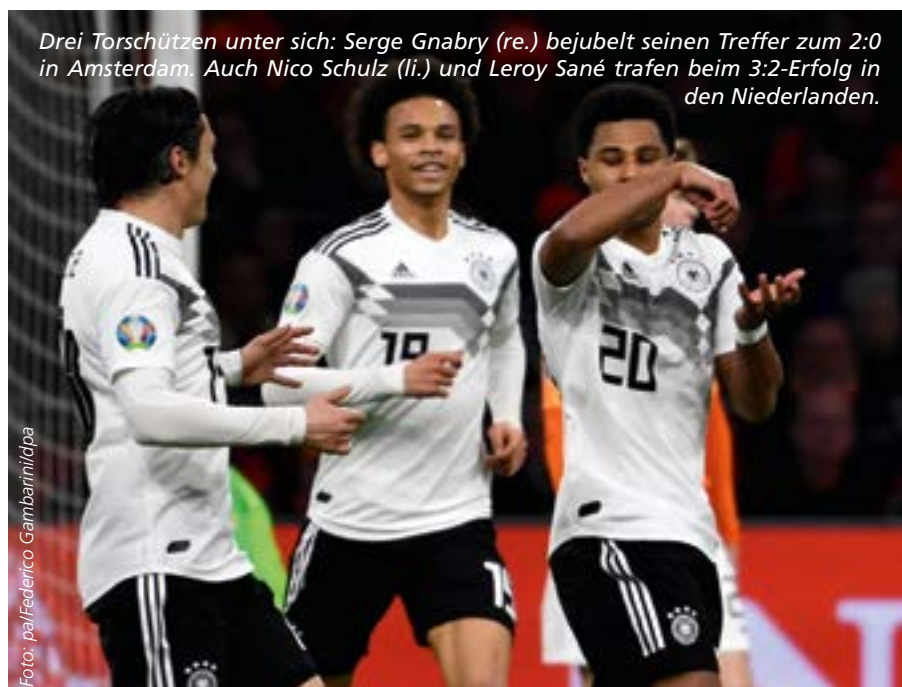
Drei Torschützen unter sich: Serge Gnabry (re.) bejubelt seinen Treffer zum 2:0 in Amsterdam. Auch Nico Schulz (li.) und Leroy Sané trafen beim 3:2-Erfolg in den Niederlanden.

Im März 2020 werden in Play-off-Spielen, dann mit den Siegern der jeweiligen Gruppen in den Ligen B bis D der Nations League, drei weitere, direkte Starter für die Europameisterschafts-Endrunde 2020 ermittelt. Der generelle Qualifikationswettbewerb bleibt weitgehend unverändert. 20 EM-Startplätze werden in den seit März dieses Jahres ausgetragenen Qualifikationsspielen in zehn Fünfer- bzw. Sechsergruppen ermittelt – hier lösen die Erst- und Zweitplatzierten jeweils das Ticket zur EM direkt.