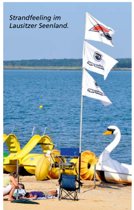
Strandfeeling im Lausitzer Seenland.

aus einer anderen Welt und hat sich doch überall schon überall breitgemacht, am Geierswalder See zum Beispiel. Hier dümpeln die angeleinten Segelboote vor sich hin. Ein paar Gäste bevölkern den Freisitz des Hotels. Sogar ein Leuchtturm grüßt in die nahe Weite. Am Badestrand liegt eine ganze Armada auslaufbereit am Ufer: Segelboote, Katarane, Surfbretter, Ka-