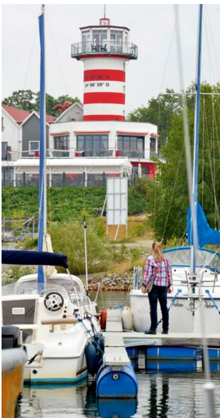
Leuchtturm am Geierswalder See.

Einst prägte der Bergbau die Lausitz und hinterließ deutliche Spuren. Seit den 1970er Jahren erlebt die Region einen Strukturwandel. Aus stillgelegten, gefluteten Tagebaugruben entsteht die größte von Menschenhand geschaffene Wasserlandschaft Europas: das Lausitzer Seenland, halb in Sachsen, halb in Brandenburg. Eine Gegend zum Umschauen, Eintauchen und Aufatmen.