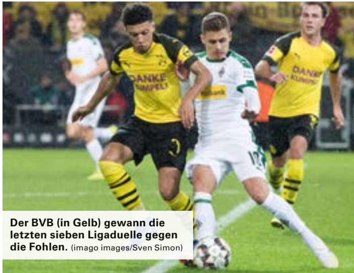
Der BVB (in Gelb) gewann die letzten sieben Ligaduelle gegen die Fohlen.