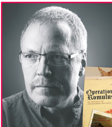
acabus Verlag Autor: Carsten Zehm

Operation Romulus. Das Geheimnis der verschwundenen Nazi-Elite