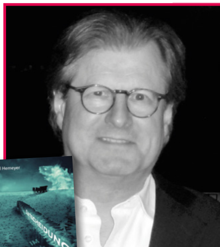
acabus Verlag Autor: Karl Hemeyer

Entscheidung im Wattenmeer. Die Geschichte einer Liebe in einer knallharten Geschäftswelt