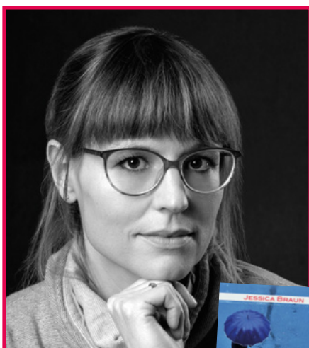
Lauinger Verlag Autor: Jessica Braun