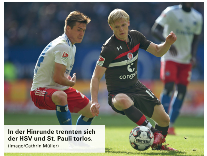
In der Hinrunde trennten sich der HSV und St. Pauli torlos.