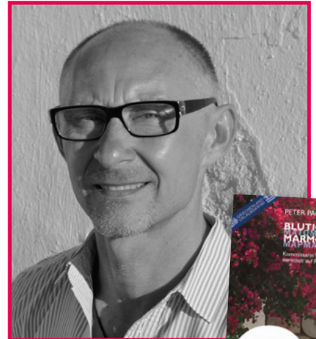
Größenwahn Verlag Autor: Peter Pachel