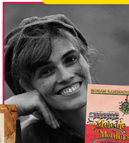
Carpathia Verlag Autor: Miriam Rademacher