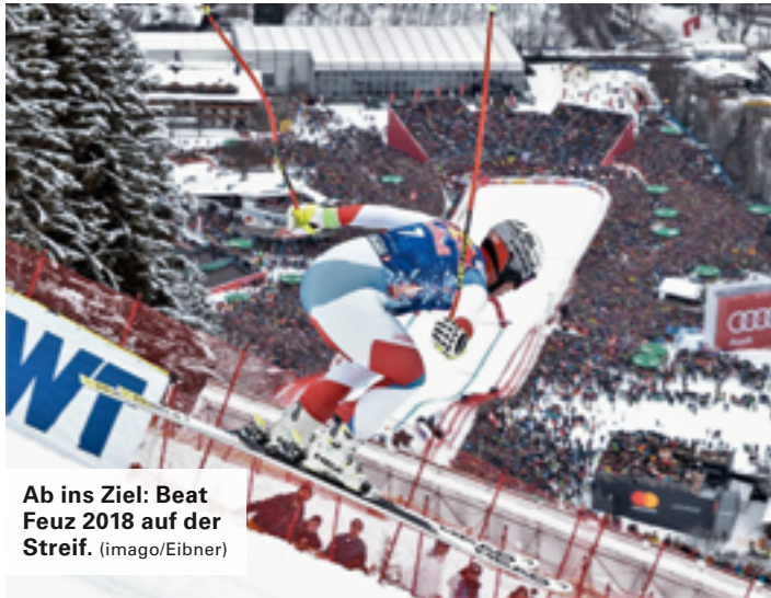
Ab ins Ziel: Beat Feuz 2018 auf der Streif.