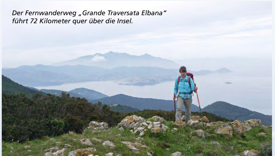
Der Fernwanderweg „Grande Traversata Elbana“ führt 72 Kilometer quer über die Insel.

Küste, für das tiefblaue Meer, den gelben Ginster und die Kaktusfeigen, die am Wegesrand blühen. Oder für die einsame Stille, in der nur das Surren der Bienen und das Rauschen des Windes zu hören sind. Wer hier wandert, sucht