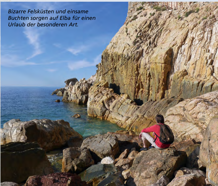
Bizarre Felsküsten und einsame Buchten sorgen auf Elba für einen Urlaub der besonderen Art.

Elba ist etwa doppelt so groß wie Sylt und die drittgrößte Insel Italiens. Während man im Osten durch die Welt des Eisens wandert, steht der Westen im Zeichen des Granits. Hier haben vor Millio-