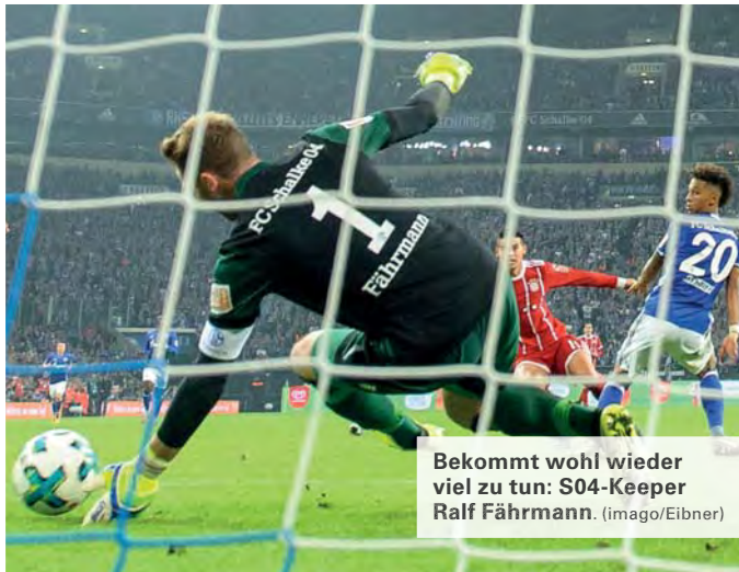
Bekommt wohl wieder viel zu tun: S04-Keeper Ralf Fährmann.