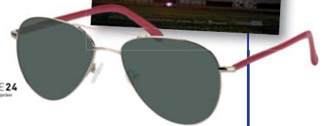
BRILLE24 Dark Outdoor-Optiker

Nachdem Monate vergangen sind, ohne dass der Mörder ihrer Tochter ermittelt wurde, bemalt Mildred Hayes drei Plakatwände an der Stadteinfahrt mit provozierenden Sprüchen, die den Polizeichef Willoughby zwingen sollen, sich um den Fall zu kümmern. Schnell verschärft sich der Konflikt zwischen Mildred und den Ordnungshütern des verschlafenen Städtchens.