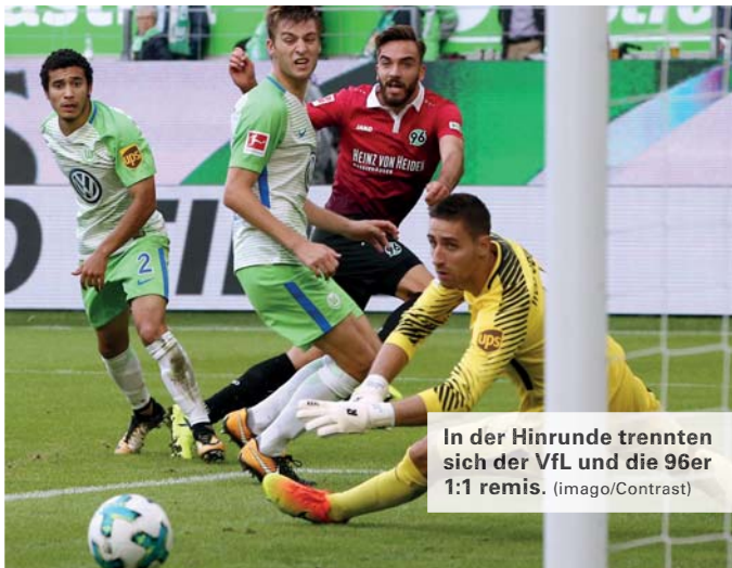
In der Hinrunde trennten sich der VfL und die 96er 1:1 remis.