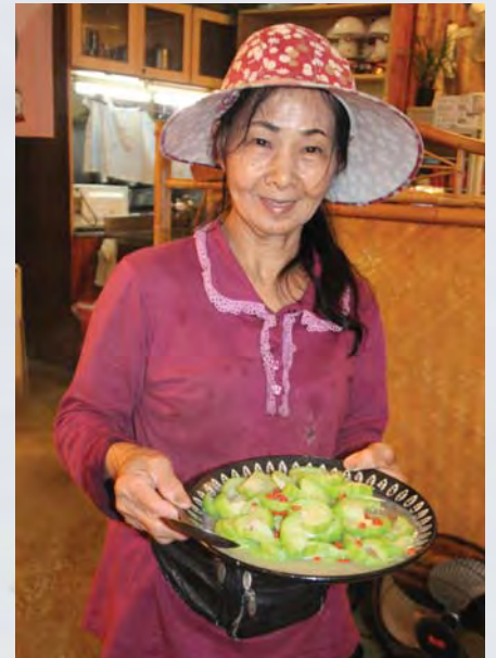
Die Teehäuser am Maokong servieren nicht nur Tee, sondern auch hervorragende Speisen.

Eine Spezialität des Hauses ist der Guanyin-Tee, ein besonders dunkler und starker Oolong-Tee. Guanyin ist eine hei-