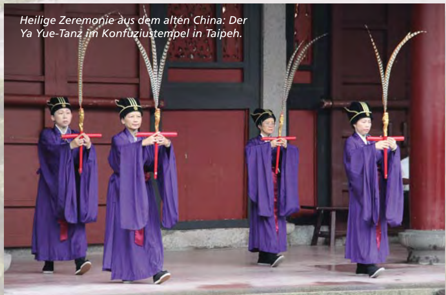
Heilige Zeremonie aus dem alten China: Der Ya Yue-Tanz im Konfuziustempel in Taipeh.

i www.taiwantourismus.de www.china-airlines.com/de/de