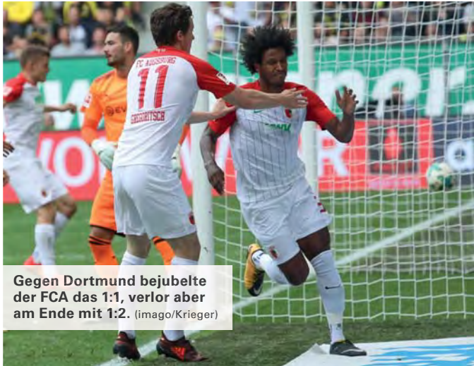
Gegen Dortmund bejubelte der FCA das 1:1, verlor aber am Ende mit 1:2.