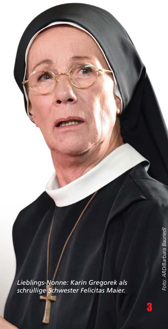
Lieblings-Nonne: Karin Gregorek als schrullige Schwester Felicitas Maier.

An der Seite von Fritz Wepper und Janina Hartwig spielt Karin Gregorek (Jahrgang 1941) seit 2002 die eigenwillige Schwester Felicitas im ARD-Dauerbrenner „Um Himmels Willen“. Bekannt wurde die Berlinererin durch zahlreiche Rollen in Serien wie „Unser Lehrer Doktor Specht“, „Der Bulle von Tölz“ oder „Mama ist unmöglich“. Nach der Schauspielausbildung von 1961 bis 1963 stand sie unter anderem auf der Bühne des Anhaltischen Theaters in Dessau und führte Regie am Maxim-Gorki-Theater in Berlin.