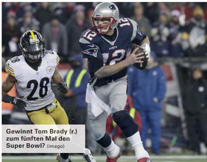
Gewinnt Tom Brady (r.) zum fünften Mal den Super Bowl?