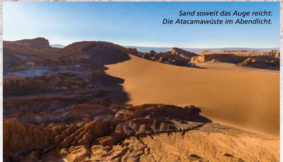
Sand soweit das Auge reicht: Die Atacamawüste im Abendlicht.

gerade Medialunas, kleine, schmerzhaft süße Croissants, als Nacho den Motor anlässt. Das Abenteuer beginnt!