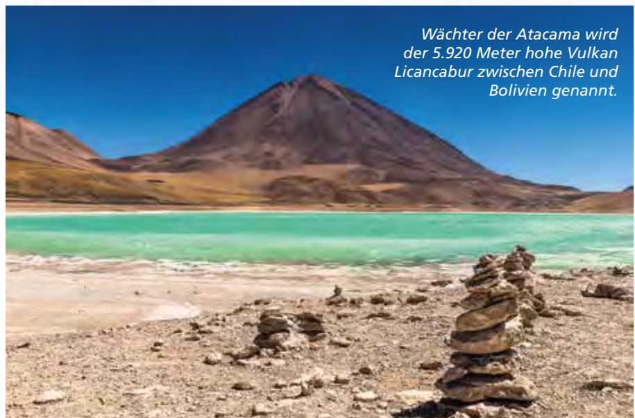
Wächter der Atacama wird der 5.920 Meter hohe Vulkan Licancabur zwischen Chile und Bolivien genannt.

Die Hügel sehen aus wie auf einem impressionistischen Gemälde. Wir begegnen Lamas, Alpakas und Flamingos. Der letzte Höhepunkt der Reise ist der Salar de Uyuni, der größte Salzsee der Erde. Für uns heißt es dann leider Abschied nehmen von dieser einmaligen Landschaft. Zehn Tage, drei Länder, knapp 6.000 Kilometer und einen geplatzten Reifen später hat uns das pulsierende Leben der 13-Millionen-Stadt Buenos Aires wieder.