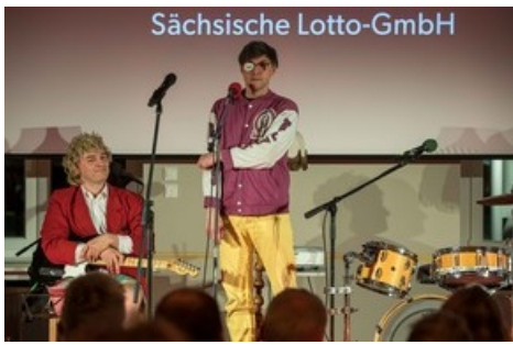
Für viele Lacher sorgte das Musik-Kabarett-Duo „Zärtlichkeiten mit Freunden“.

Diese Meldung kann unter https://www.presseportal.de/pm/151515/5740116 abgerufen werden.